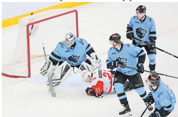
У ворот Юнаса Энрота

Минское «Динамо» набрало 5 из 6 возможных очков в домашней серии, дав понять: его пока рано списывать со счетов в борьбе за плей-офф