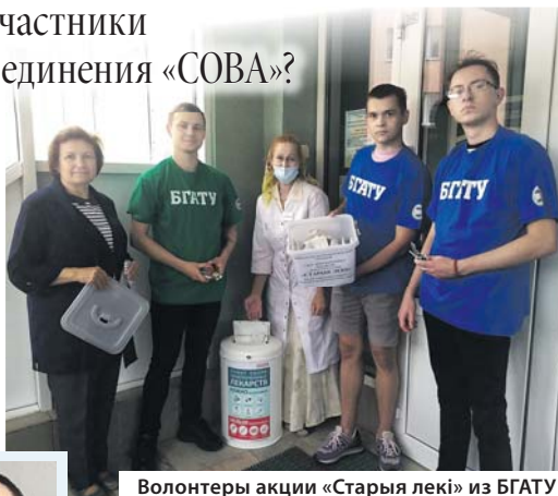
Волонтеры акции «Старья леки» из БГАТУ

Студенты из «СОВЫ» помогают воспитанникам домов-интернатов, пожилым людям, заботятся о животных, участвуют в экологических проектах.