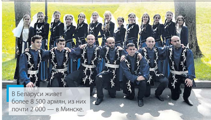
В Беларуси живет более 8 500 армян, из них почти 2 000 — в Минске.