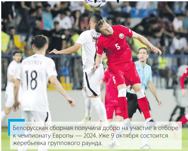
Белорусская сборная получила добро на участие в отборе к чемпионату Европы — 2024. Уже 9 октября состоится жеребьевка группового раунда.

В отборе к чемпионату мира — 2022 белорусы провели восемь матчей. Итог плачевный: всего одна победа и семь поражений. Разница пропущенных и забитых мячей впечатляет — 24:7. А еще последнее место в своей группе. Из-за таких, мягко говоря, скромных результатов в адрес тренерского штаба год назад летело немало критических стрел. Однако наставники просили дать время на формирование новой команды, говорили о вливании молодой крови. И слово сдержали.