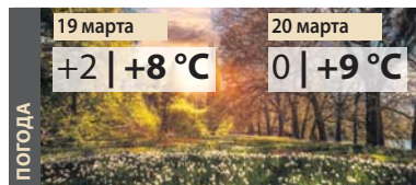
Марина ГОНЧАРУК, фото автора

Топ-3 материалов свежего выпуска «Вечернего Минска» 20 марта