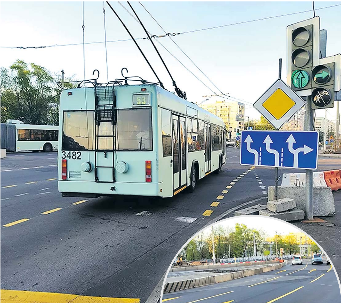
Схема движения транспорта изменилась в районе пересечения улиц М. Богдановича и Кульман

Н ововведение касается водителей, которые направляются со стороны площади Бангалор к перекрестку: сразу за регулируемым пешеходным переходом, который ведет от дома № 78 к парку Дружбы народов, проезжая часть резко уходит вправо и далее проходит по извилистой траектории. Об этом предупреждает дорожный знак. Скорость движения транспорта ограничена 40 км/ч.