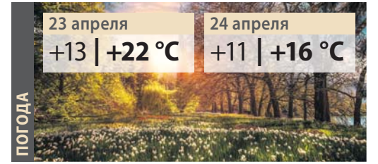
Игорь ГОЛОД, фото автора

Топ-3 материалов свежего выпуска «Вечернего Минска» 24 апреля